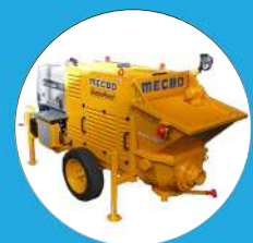
POMPE À BETON