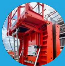
BANCHES DE COFFRAGE