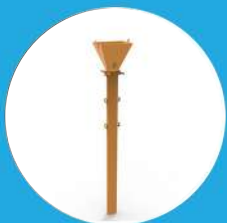
RACK DE TUBES PLONGEUR