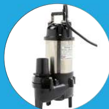
POMPE DE RELEVAGE