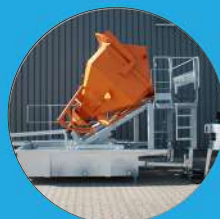
BENNE À BETON