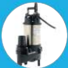
POMPE DE RELEVAGE