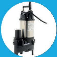
POMPE DE RELEVAGE