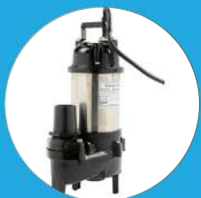
POMPE DE RELEVAGE