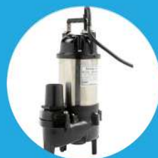
POMPE DE RELEVAGE